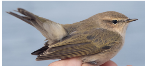
Sibirisk gransångare