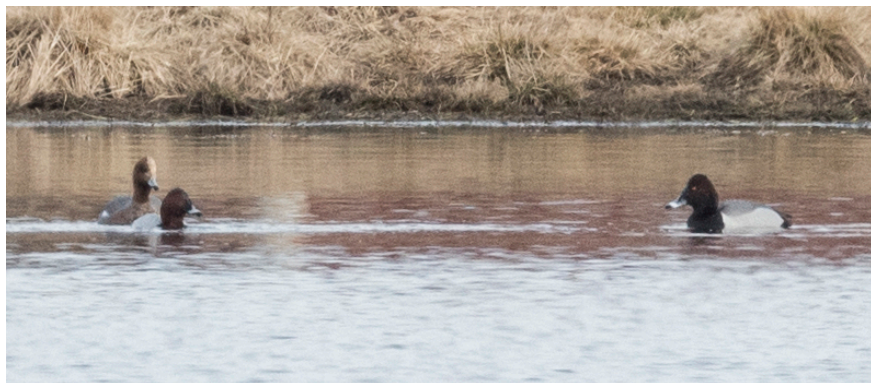
Hybrid brunand x vigg (till höger)