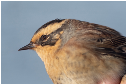
Sibirisk järnsparv

1 ex ringm St Fjäderägg 6.10 (Andreas Garpebring, Benny Wälitalo, Julia Pettersson m.fl.). Fjärde fyndet för Västerbotten och andra fyndet för Stora Fjäderägg. Det första fyndet för landskapet är från 1988 och som då var det sjätte för landet. Västerbotten fick sitt andra och tredje fynd under det stora "sibjärnåret" i Europa 2016, då Sverige fick 71 nya fynd. Årets fynd innebar kröningen av en dryg veckas inflöde av östliga rariteter till Stora Fjäderägg under v 39-40. Fyndet var det enda i landet under året.