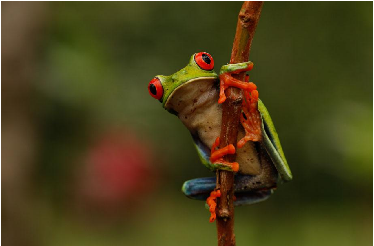
Det är inte bara fåglar vi kommer att uppleva i regnskogen. Vi får också bekanta oss med diverse färggranna grodor – en del av dem giftiga!