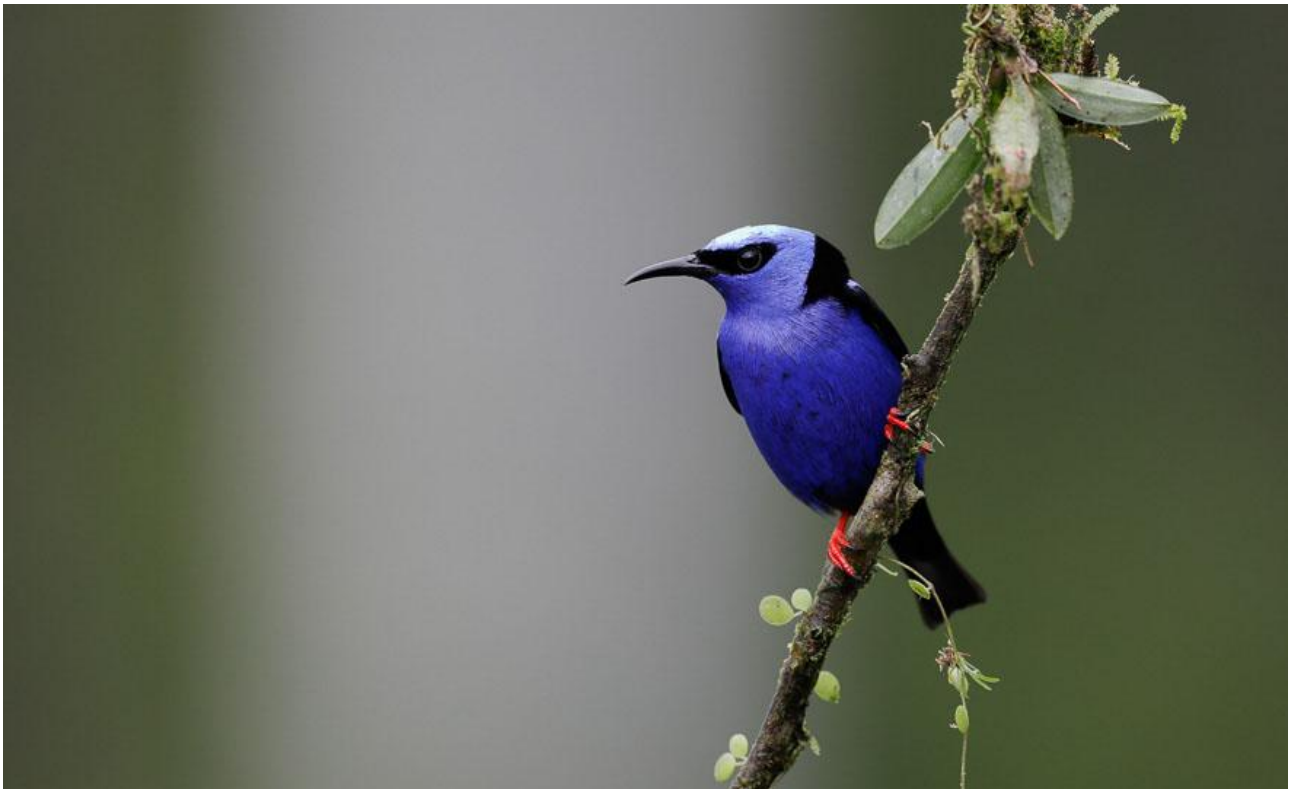
Red-legged Honeycreeper är vanlig upp till 1 200 meters höjd på Stilla havssidan i Costa Rica.