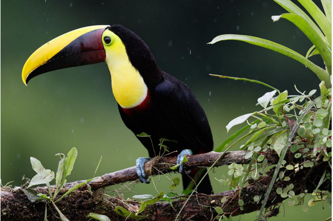
Denna Chestnut-mandible Toucan, är en av flera arter tukaner vi hoppas se på vår resa.