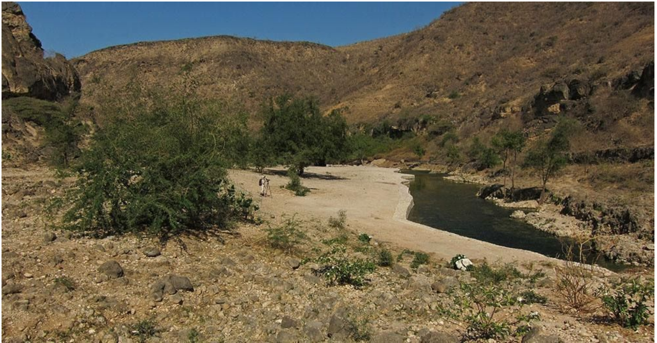
Bergskällan Ayn Razat, en fågelrik miljö.