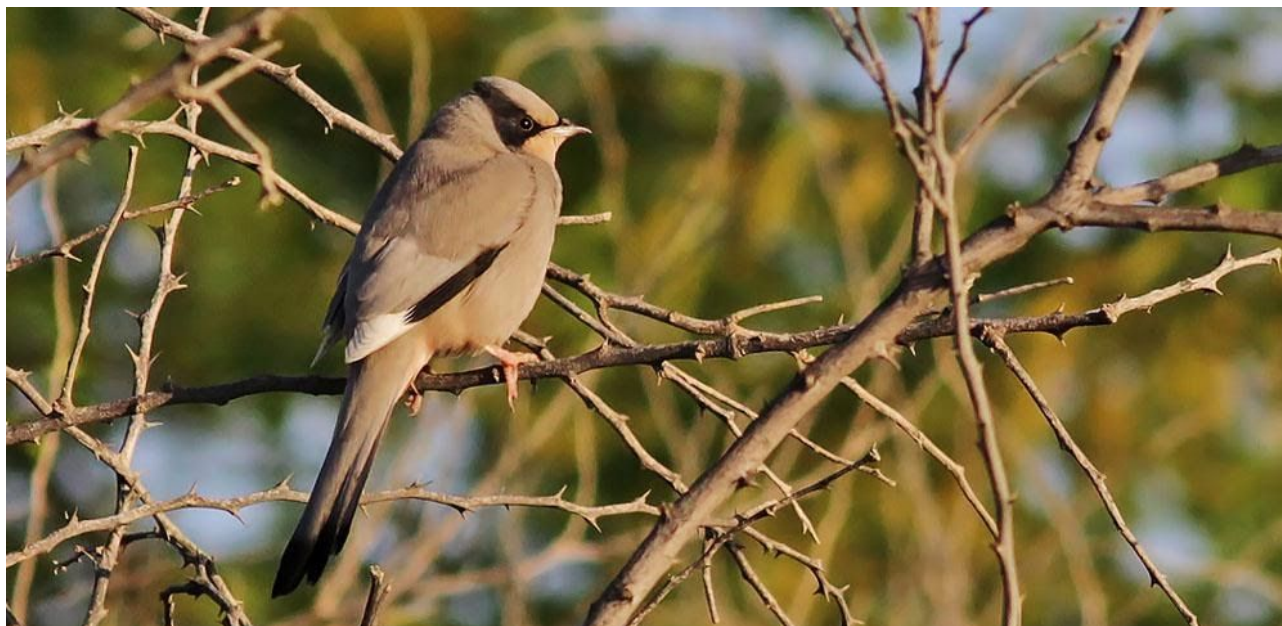
Många längtar efter att få se hypokolius, här en hane.