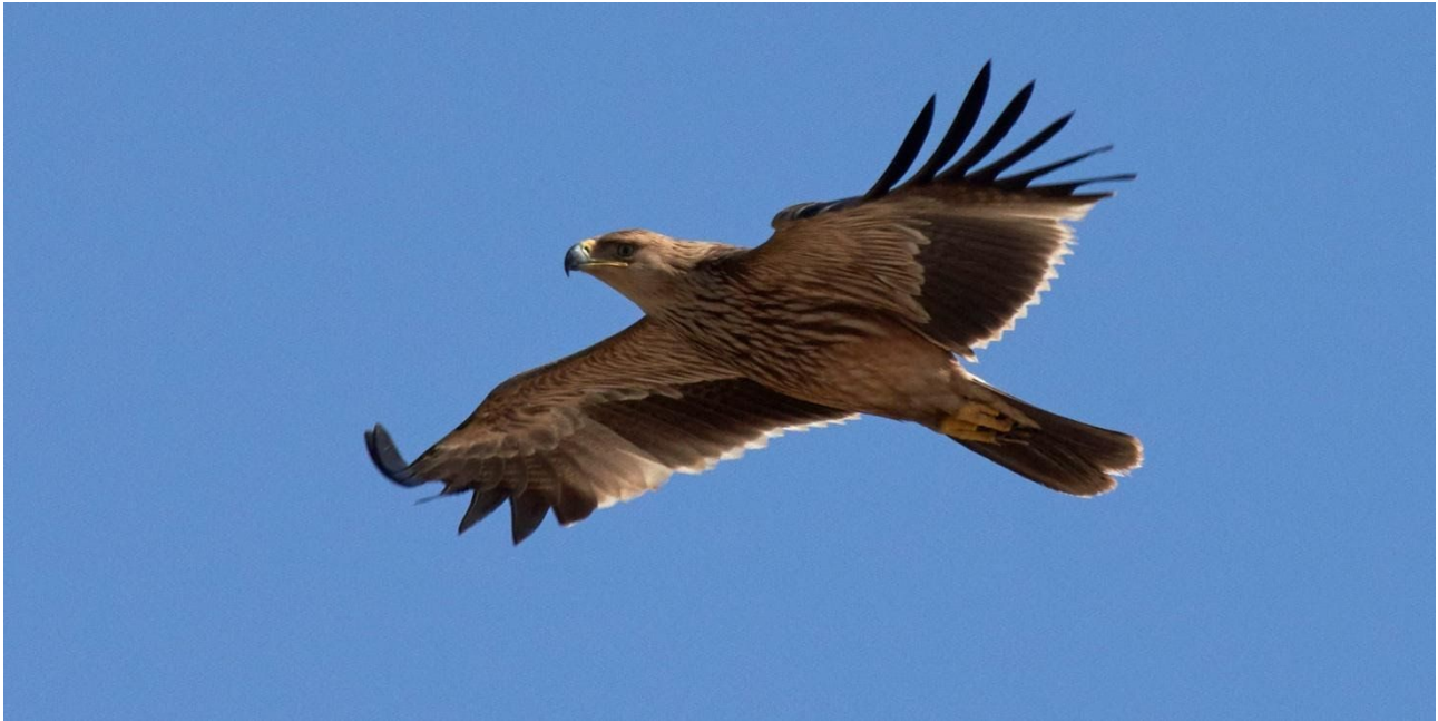
Kejsarörn kan ses lite här och där. Här en ungfågel.