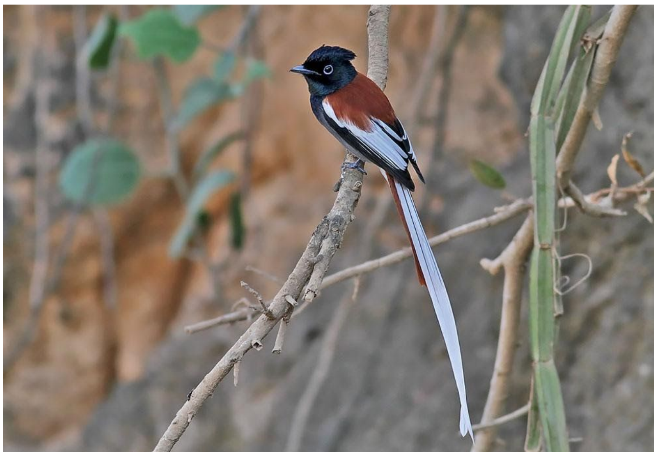
Afrikansk paradisonark. Här den rarare formen med vit stjärt.