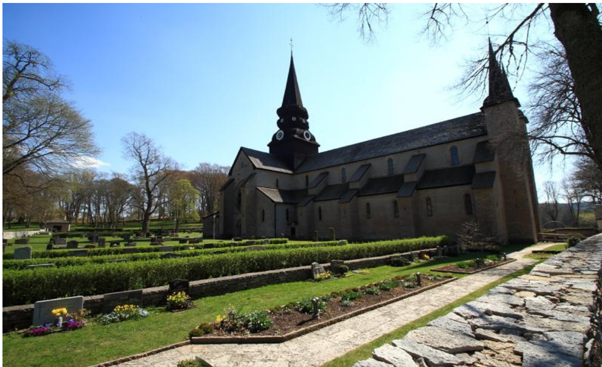
Varnhems klosterkyrka.

29 mars. Tidig avresa före soluppgången till Skövde skjutfält för att uppleva spelande orttuppar och sjungande trädlärkor. Frukost på Qvarnen och därefter checkar vi ut och skådar vid Udskovet eller Trandansen. Resan avslutas före lunch på Skövde C.