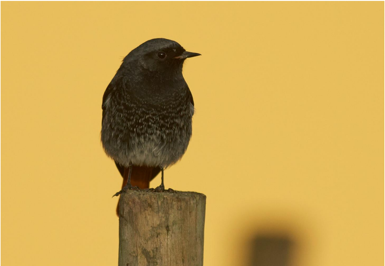
Svart rödstjärt.