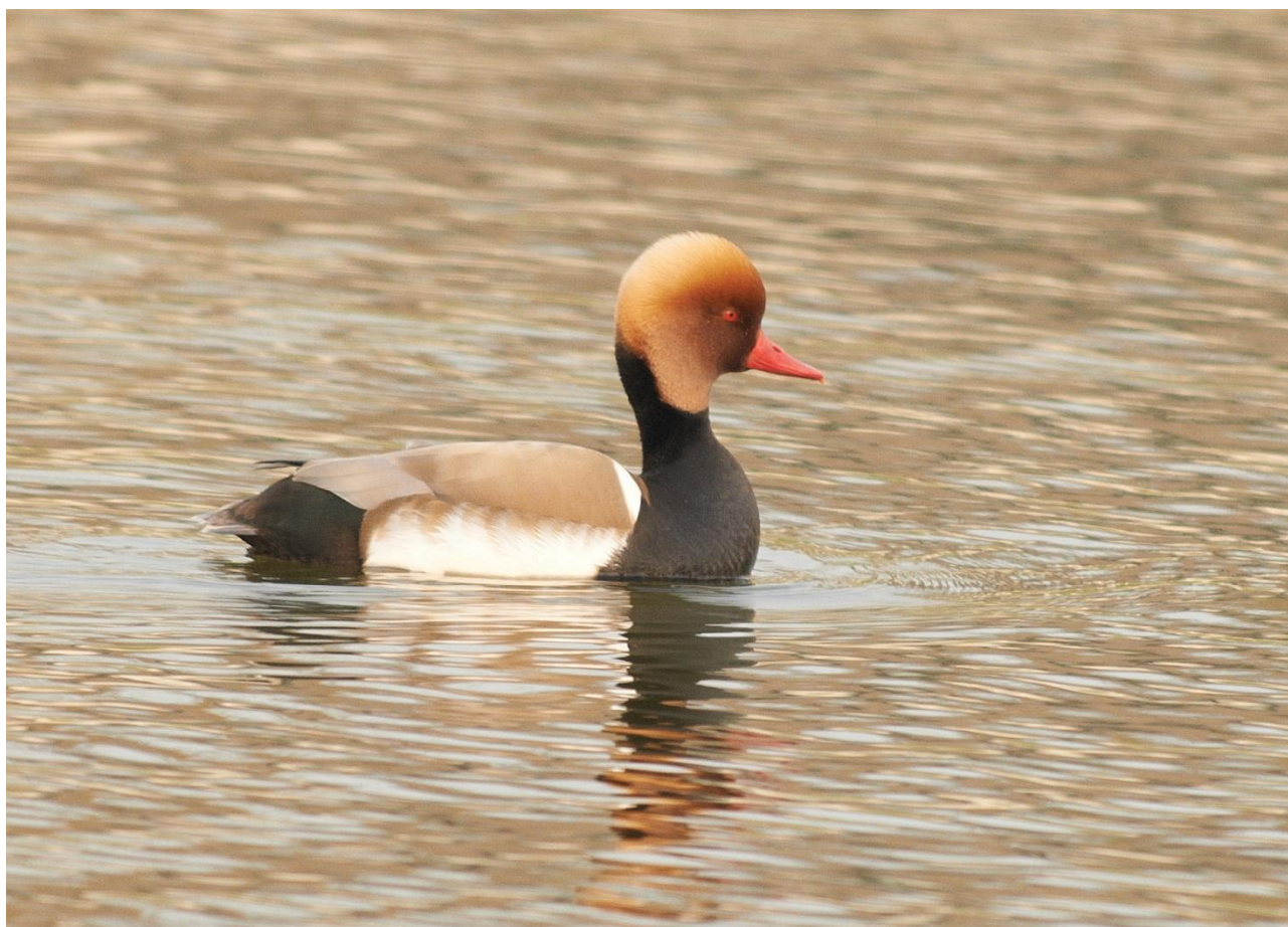
Rödhuvad dykand.