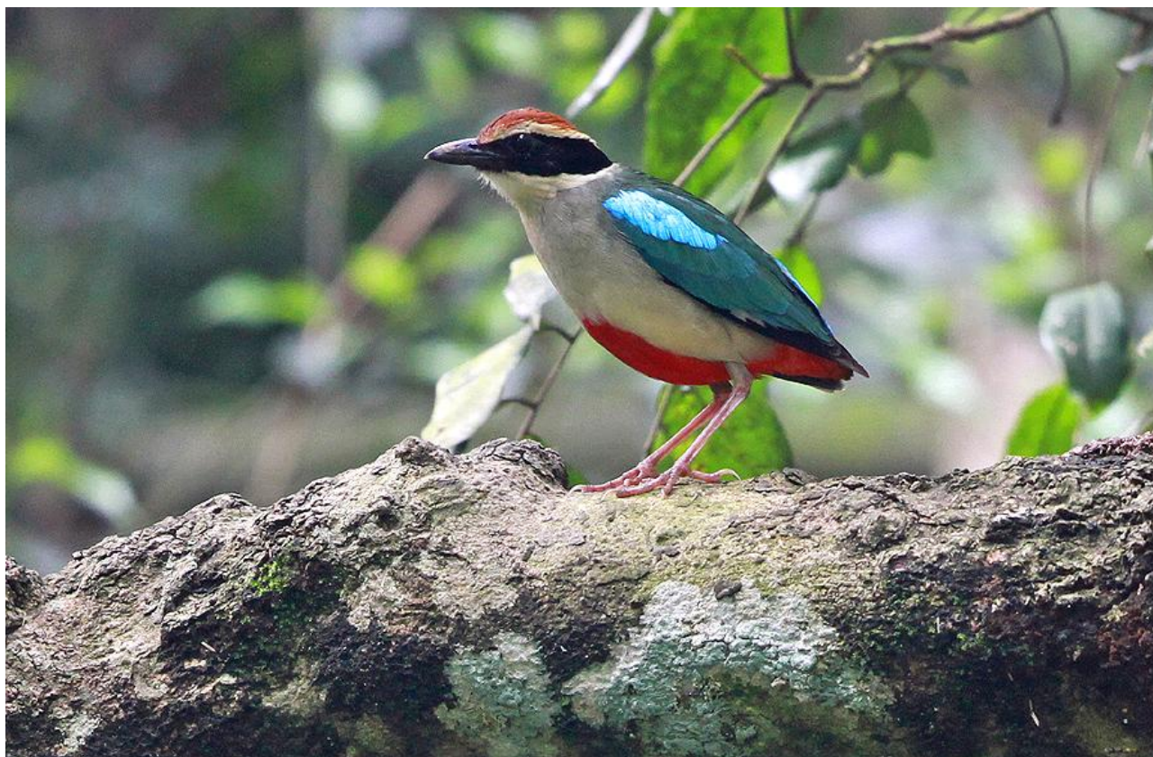
Fairy Pitta.

försöka se denna mycket vackra art. En rad andra, intressanta fåglar finns också i området, t ex Black-necklaced och Taiwan Scimitar-Babbler, samt Dusky Fulvetta. Färden går sen vidare till Chiayi, där vi speciellt kommer spana efter Swinhoe's Pheasant och Taiwan Partridge. När skymningen fallit på lyssnar vi efter Mountain Scops-Owl. Natt i Chiayi.