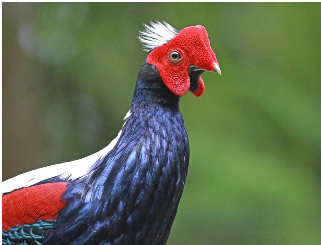
Swinhoe's Pheasant.