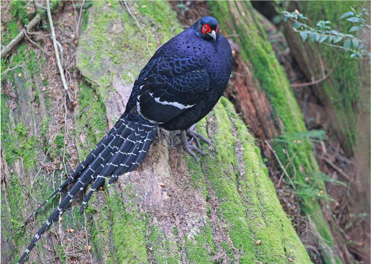
Mikado Pheasant.

26 april. Resan startar på Taipeis internationella flygplats. Lite beroende på när vi anländer i Taipei, hinner vi eventuellt med ett besök i Daan Park. Här finns bl a Taiwan Barbet och den sällsynta Malayan Night Heron. Natt i Taipei.