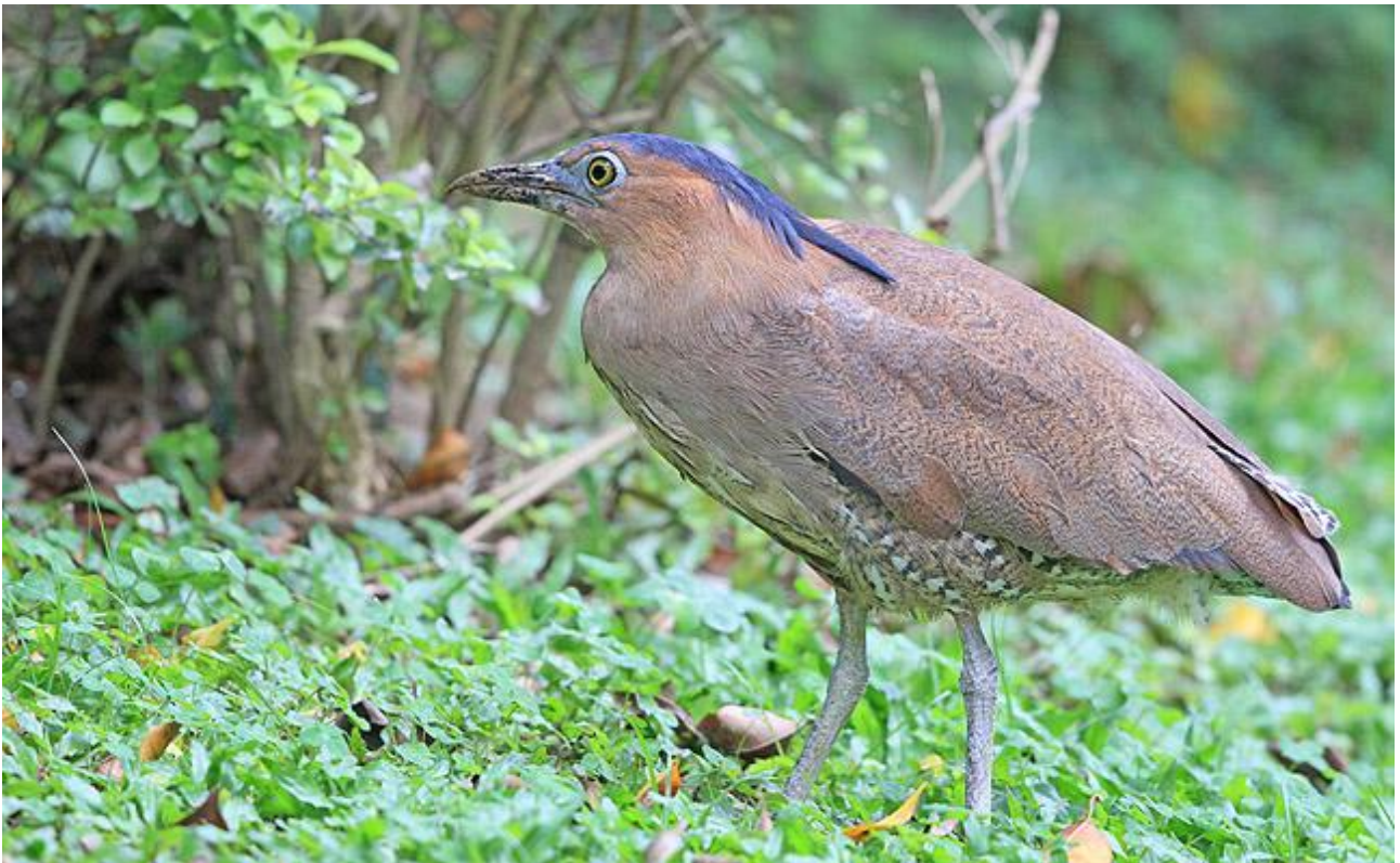
Malayan Night Heron.

1 maj. Vi skådar i låglandet kring Pingtung, där målarten är den sällsynta och endemiska Taiwan Bulbul. Vi fortsätter sen mot norr längs sydvästkusten, via Chiku och Beimen, där vi skådar i det mycket omfattande området med dammar och våtmarker. Vi kan förvänta oss ett flertal arter hägrar, ev Cinnamon och Yellow Bittern, många vadare, samt genomflyttande skägg- och vitvingade tärnor. Natt i Linnei.