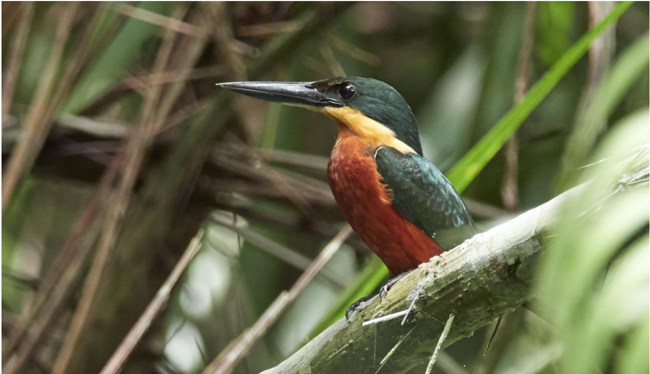
Green-and-rufous Kingfisher.

Vi kör tillbaka till vår camp i skymningen och kollar efter Common Pauraque och Tropical Screech-Owl längs vägen. Natt på Canopy Camp.