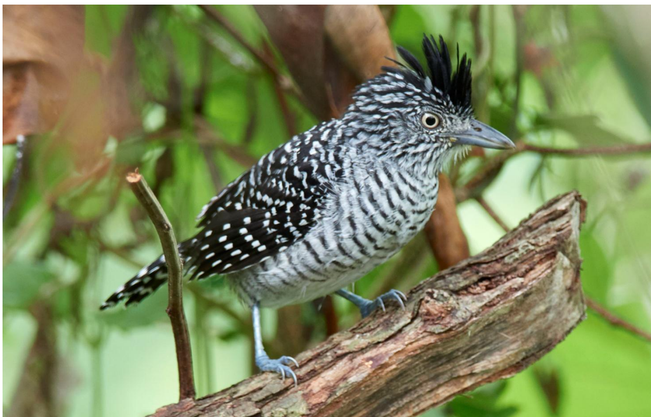
Barred Antshrike.

Nästa stopp blir vid Río Mono Bridge. Skogarna här är fågelrika och vi har chans att träffa på One-colored Becard, Black-headed Tody-Flycatcher, Blue Cotinga, Pied Puffbird, Orange-crowned Oriole, Blue Ground-Dove m m. I själva floden finns Green-and-rufous Kingfisher och den skygga Fasciated Tiger-Heron.