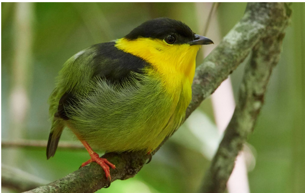
Golden-collared Manakin.

19 apr. Förmiddagens lokal är La Mesa Road. Ett område med blandning av sekundärskog, ängsmarker och övergivna gårdar. Här ser vi speciella fåglar som Spot-crowned Barbet, Cinnamon Becard, Scarlet-thighed Dacnis, Silver-throated, Golden-hooded, Tawny-crested och Bay-headed Tanagers, Spot-crowned Antvireo och Spotted Woodcreeper. Bland kolibrierna finns White-tipped Sickbill, Rufous-crested Coquette, Crowned Woodnymph och Black-throated Mango. Ytterligare häckfåglar här är Blue-throated Toucanet, Bran-colored Flycatcher, Scale-crested Pygmy-Tyrant och Orange-bellied Trogon. Lunch på Canopy Lodge.