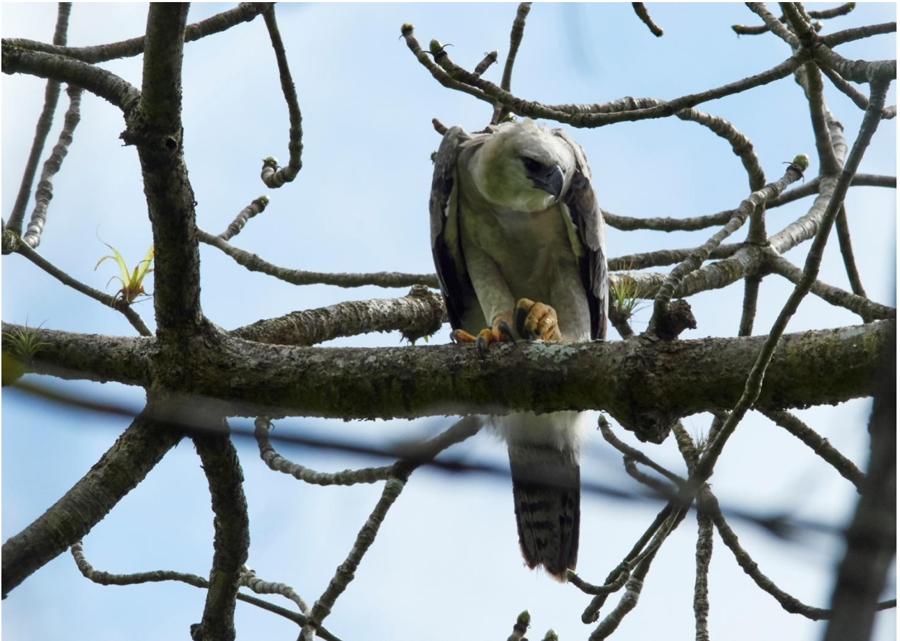
Harpy Eagle.