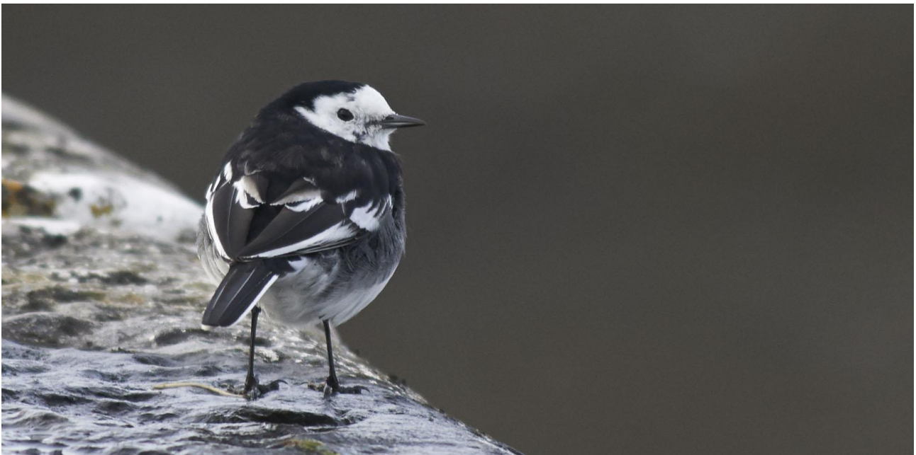
Sädessärla av den lokala rasen yarellii .

4 mars. Fågelskådning kring Dublin på förmiddagen med en av Irlands kändaste fågelskådare. Vi kommer att se myrspovar, simänder av olika slag, snösparvar och lärkor. Sedan cirka 4 timmars körning till Belmullet, på västra Irland. Något stopp på vägen. Natt i Belmullet.