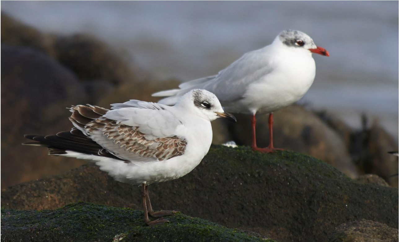
Svarthuvad mås.

5 mars. Heldags fågelskådning på Belmullet med en av BirdLife Irelands anställda som guide. Belmullet är en halvö som är starkt påverkad av havet, dessutom en av Irlands bästa havsfågellokaler, speciellt höstetid. Våtmarkerna på ön brukar locka till sig amerikanska gäster som svartand, ”riktig” kanadagås och ringand. På de vackra stränderna springer sandlöpare, havssulor fiskar utanför och islommar övervintrar i goda antal. På somrarna är Belmullet ett av landets starkaste fästen för kornknarr. Natt i Belmullet.