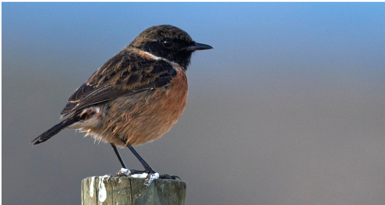
Svarthakad buskskvätta.