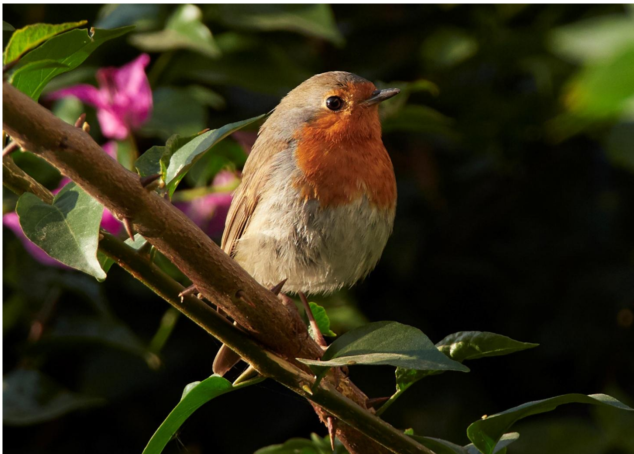
Rödhaken är en typisk flyttfågel man ser mycket av på höstarna