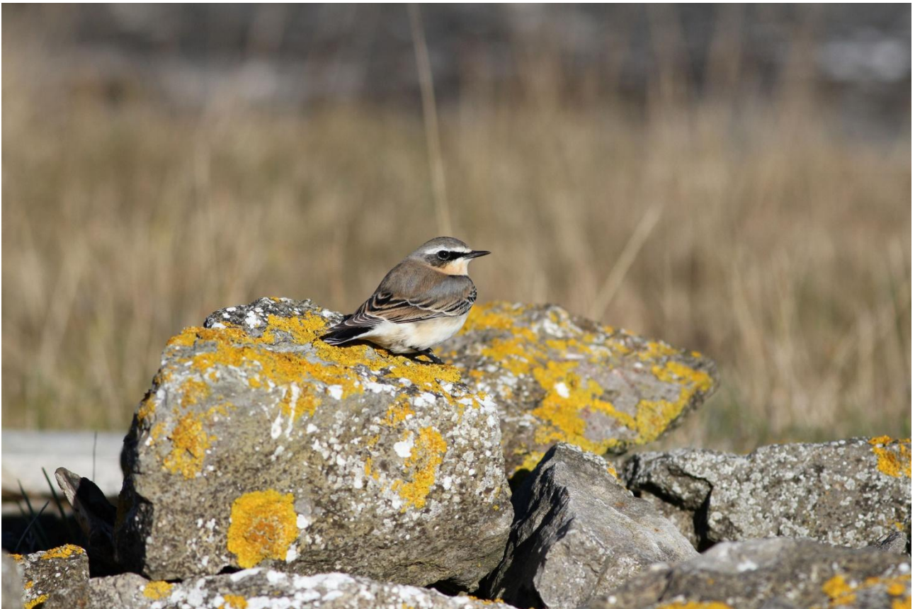
En höststenskivetta.

8 sep. Skådning under förmiddagen och kring lunch. På tidig eftermiddag avslutas resan och vi kör tillbaka till Malmö Central.