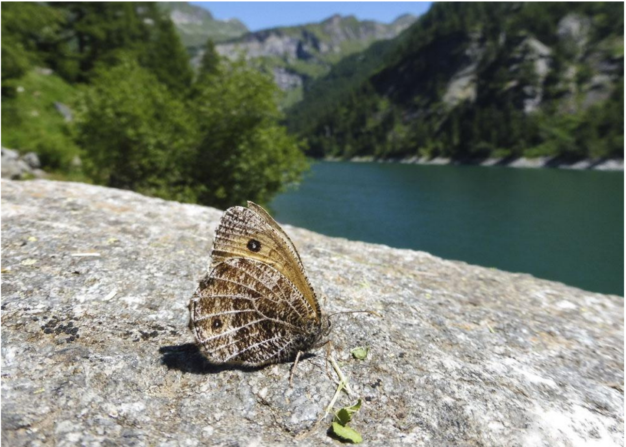
Alpine Grayling.