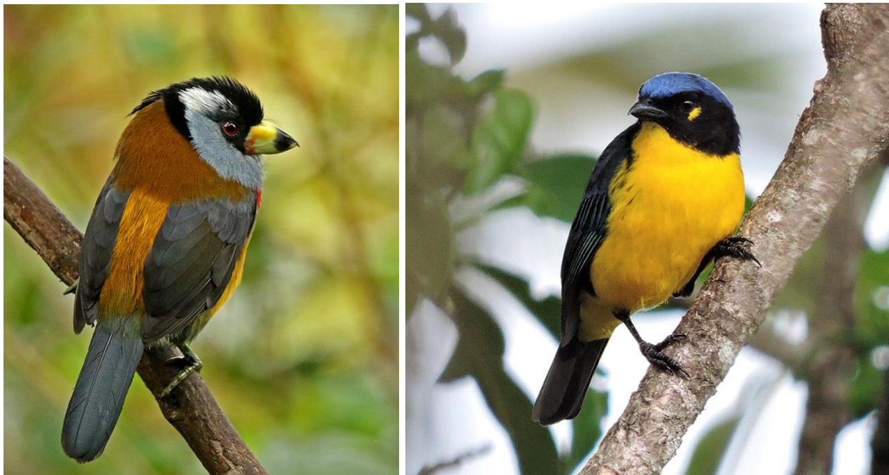
Toucan Barbet och Santa Marta Mountain Tanager.