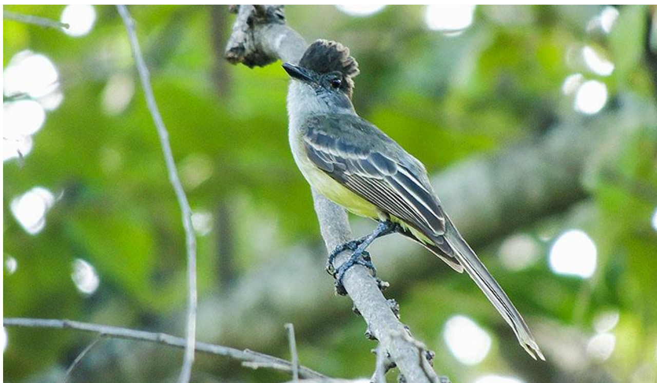
Apical Flycatcher. En av många tyrannflugsnappare under resan. Endem så klart.

samt mer spridda högländsarter som Tawny Antpitta, Many-striped Canastero och Andean Tit-Spinetail. Vi ska också besöka några av landets bästa kolibrifeeders där vi möter Rainbow-bearded Thornbill, Black-thighed Puffleg, Sword-billed Hummingbird och Buff-winged Starfrontlet bland andra. Under eftermiddagen ska vi förflytta oss till Tatama Nationalpark och vi kommer nu att befinna oss på västra sidan av Anderna, dvs i det som kallas för Chocó, ett av världens endemrikaste områden. Här bor vi tre nätter i Montezuma.