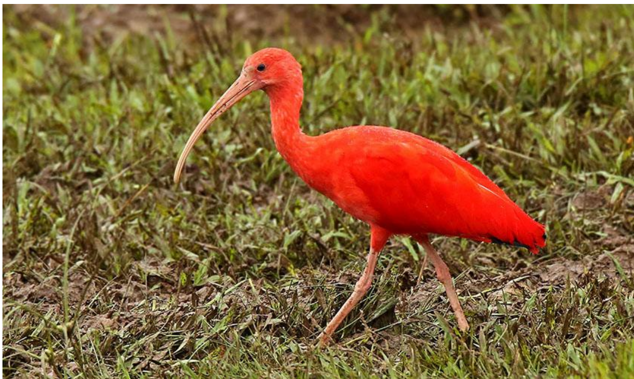
Scarlet Ibis.

Efter lunch har vi en längre transport genom Cauca dalen där vi gör några stopp för skådning och bland annat tittar efter Greyish Piculet, Colombian Chachalaca, Antioquia Wren, Golden-crowned Warbler, Greenish Elaenia och Scarlet-fronted Parakeet. Till kvällen kommer vi fram till Medellin för natten.