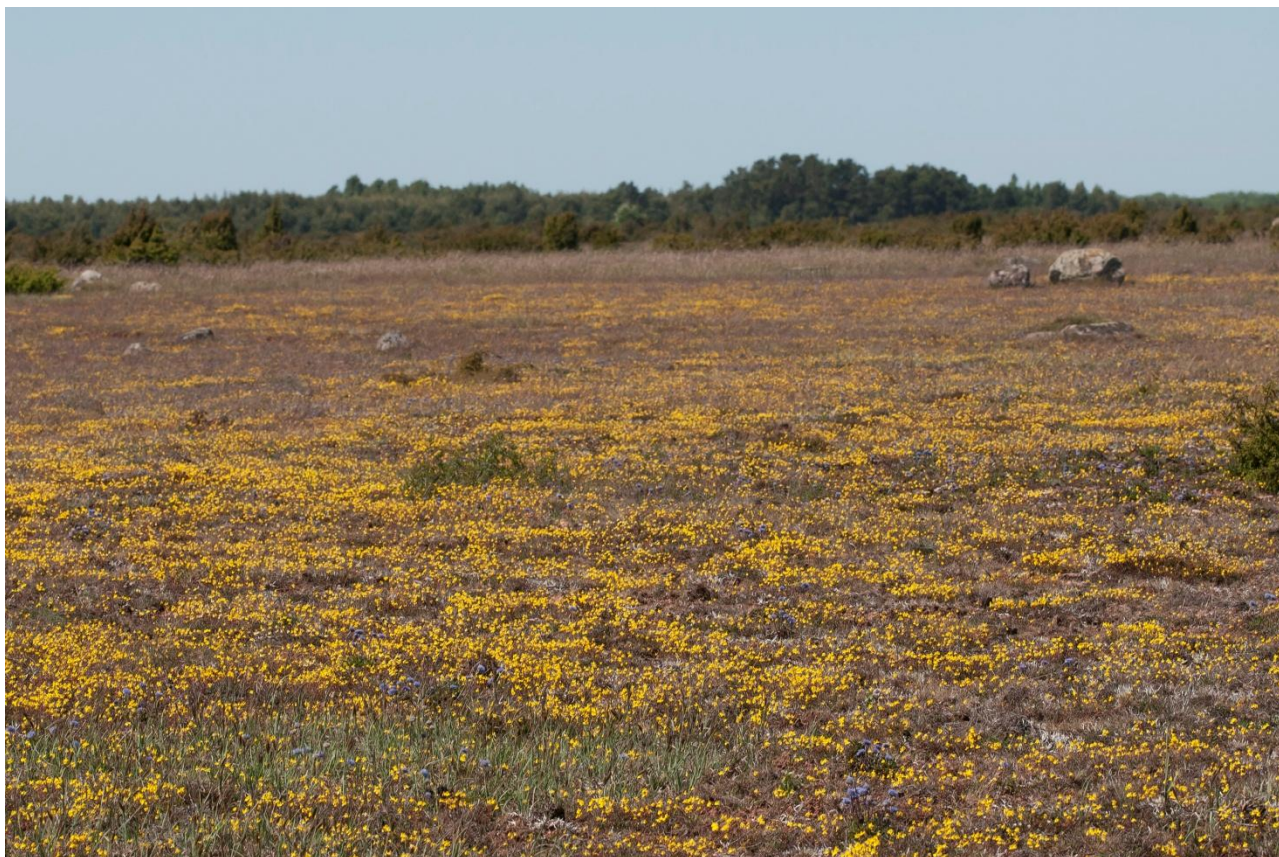
Alvar, ölandssolvända och bergskrabba.