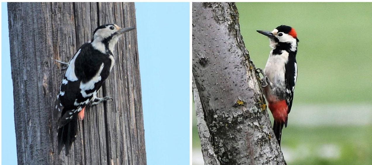
Balkanspett, hona och hane.

3 maj. Resan startar på Budapests internationella flygplats. Vi transporterar oss två timmar mot nordost och når där de städsegröna skogarna i Bukk Hills. Vi stannar under körningen för att titta efter kejsarörn och annat som finns längs vägen. Natt i Bukk Hills.