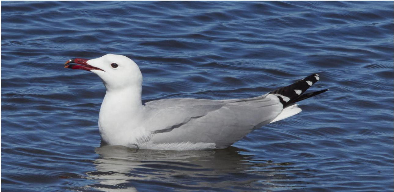
Rödnäbbad trut.

dvärgrördrom och bronsibis. Bland rastande vadare som är aktuella för årstiden uppträder dammsnäppa, småsnäppa och spovsnäppa. De svartbenta strandpiparna vi ser tillhör den lokala häckfågelfaunan, liksom rödnäbbad trut. Bland många andra arter i området kan nämnas biätare, trastsångare, svart stare, kalander- och korttålarcka, cettisångare och glasögonsångare. Nätterna i Oristano.