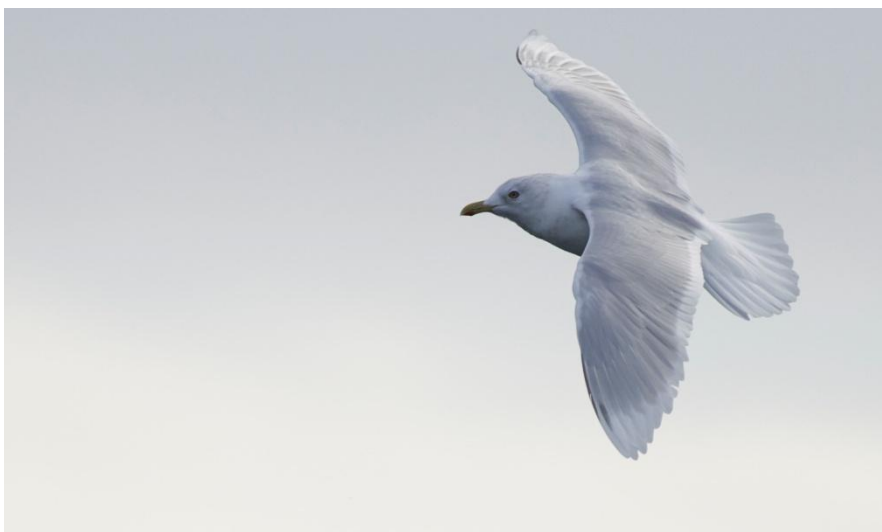
Vitvingad trut.

10 maj. Resan avslutas på Keflaviks internationella flygplats.